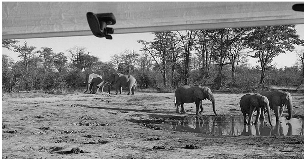
Mit den Elefanten auf Tuchfühlung