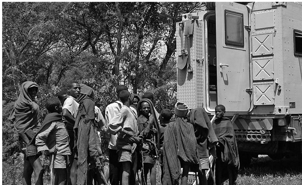
Wie hier in Äthiopien war Dienstl bei seinen Stopps schnell von Einheimischen umringt.